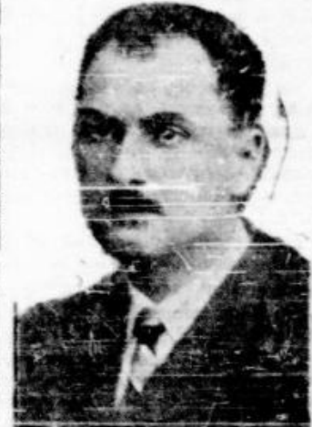
D. GH. I. BRATIANU

a vorbit în seara de 19 c. la Radio, asupra raporturilor noastre cu vechea împărăție otomană.